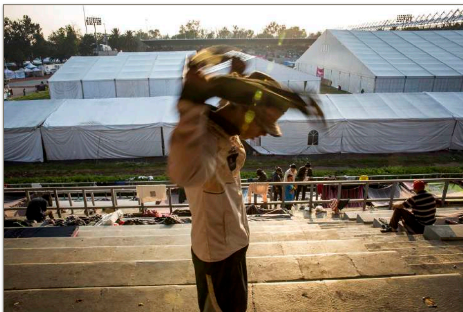
Un campo de refugiados en un estadio de la Ciudad de México

Galería de fotos de las caravanas publicadas por el medio de comunicación Plaza Pública , un espacio que busca aportar información e ideas en pos de una democracia sólida, vigorosa, con ética y justicia social. Fundado por la Universidad Rafael Landívar, Guatemala y que pertenece a la Vicerrectoría de Investigación y Proyección. No te pierdas algunas de sus fotografías.