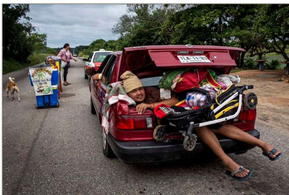
El engaño, el caos y los muertos vivos de Puebla